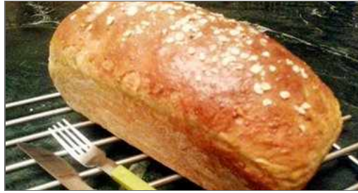
توست بيتى صحى